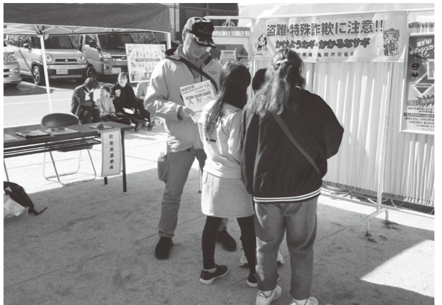
大井町民祭会場での啓発活動