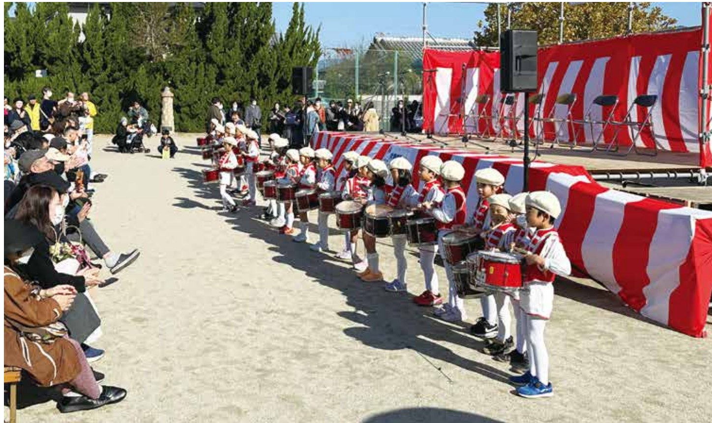
大井こども園鼓笛隊 (大井町ふれあい町民祭)