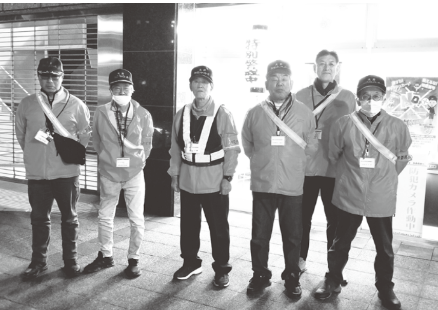
大井支部の年末特別警戒

亀岡防犯協会事務局（亀岡警察署生活安全課生活安全係） 0771-24-0110（平日午前9時～午後5時）