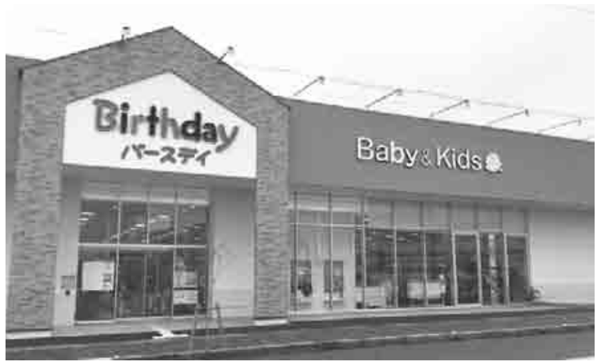
●バースデイ亀岡店 住所：京都府亀岡市大井町並河5丁目27番地 電話番号：0771-21-0020 営業時間：10時～19時