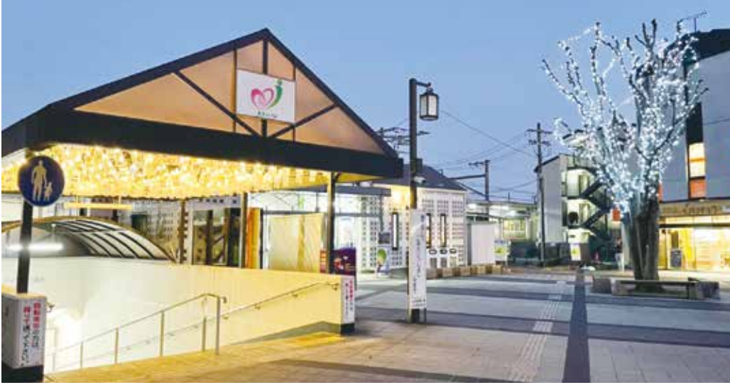
JR並河駅前ペットボトルイルミネーション (大井小学校150周年記念事業)

災害対策も進んでいます。昨年九月に、国道9号線若宮橋架替工事が完了しました。新若宮橋は河川幅が広くなり、台風や豪雨の影響が軽減されると期待できます。