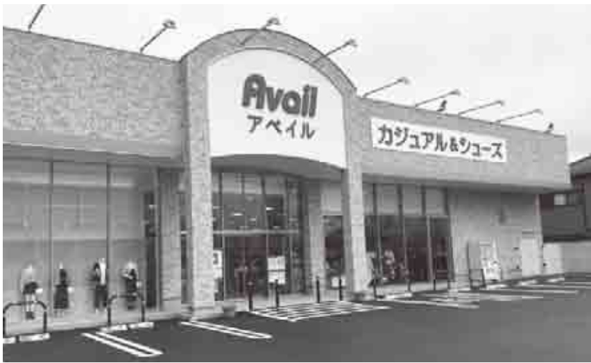
●アベイル亀岡店 住所：京都府亀岡市大井町並河3丁目22-20 電話番号：0771-56-9411 営業時間：10時～19時