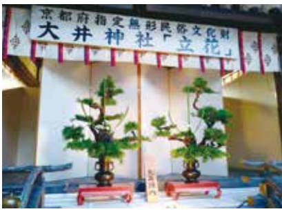
盆踊り大会は、残念ながら感染状況を踏まえ今年も中止となりました。

令和四年八月十九日花祭があり、午後六時三十分から本殿祭が挙行され、府の無形文化財に指定されている伝統行事「立花」の奉納が三年ぶりに行われました。 六地域の氏子(大井垣内、並河区、土田区、小金岐区、北金岐区・南金岐区、太田区)で作製した立花が奉納され、神前花(太田区)は本殿に向かい合う拝殿正面に、その他の区は、絵馬舎の所定の場所に立花を据え、多くの参拝客は伝統の美を鑑賞され、夏の風物詩の再開を喜び合っていました。 立花は、松の木を切り出すところから始まり、古木に松葉、松の荒皮、苔などを取り付け、本物の松に仕立て上げられます。 また、盆栽愛好者有志での盆栽奉納や露天商組合の夜店の出店もありました。