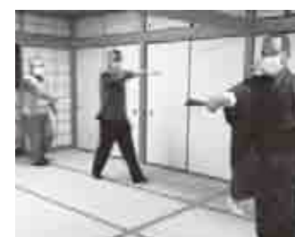
要乃会の踊りの稽古